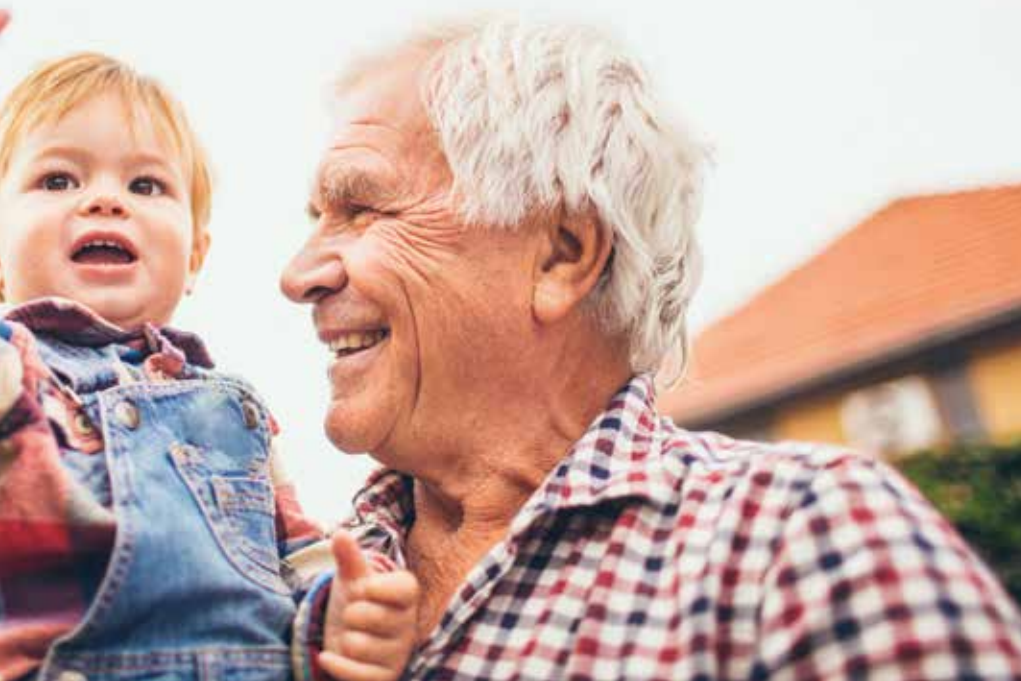
Der Anteil der Älteren innerhalb der Bevölkerung steigt, für die jüngere Generation kann das positiv sein.