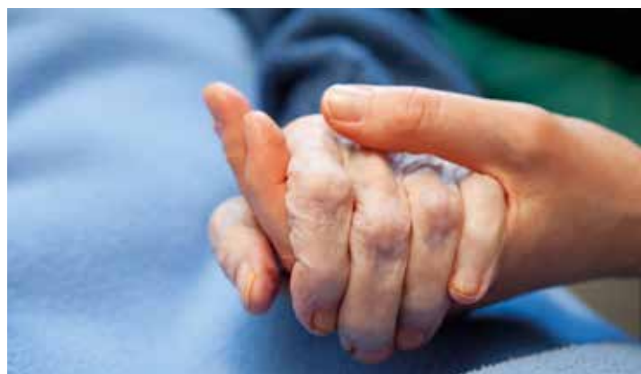
Sterben an der Hand statt durch die Hand ist das Credo der Bischofskonferenz.

Während die Befürworter und Initiatoren durch den Antrag ein „Sterben in Würde“ erhoffen, warnen Gegner vor einem Dammbruch. Sie fürchten, aus dem „Recht zu sterben“ könnte eine Pflicht